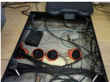
Protection de fourreaux